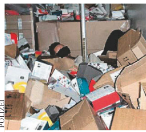
Gefesselt auf Ladefläche: Chauffeure hinter Leerkartons