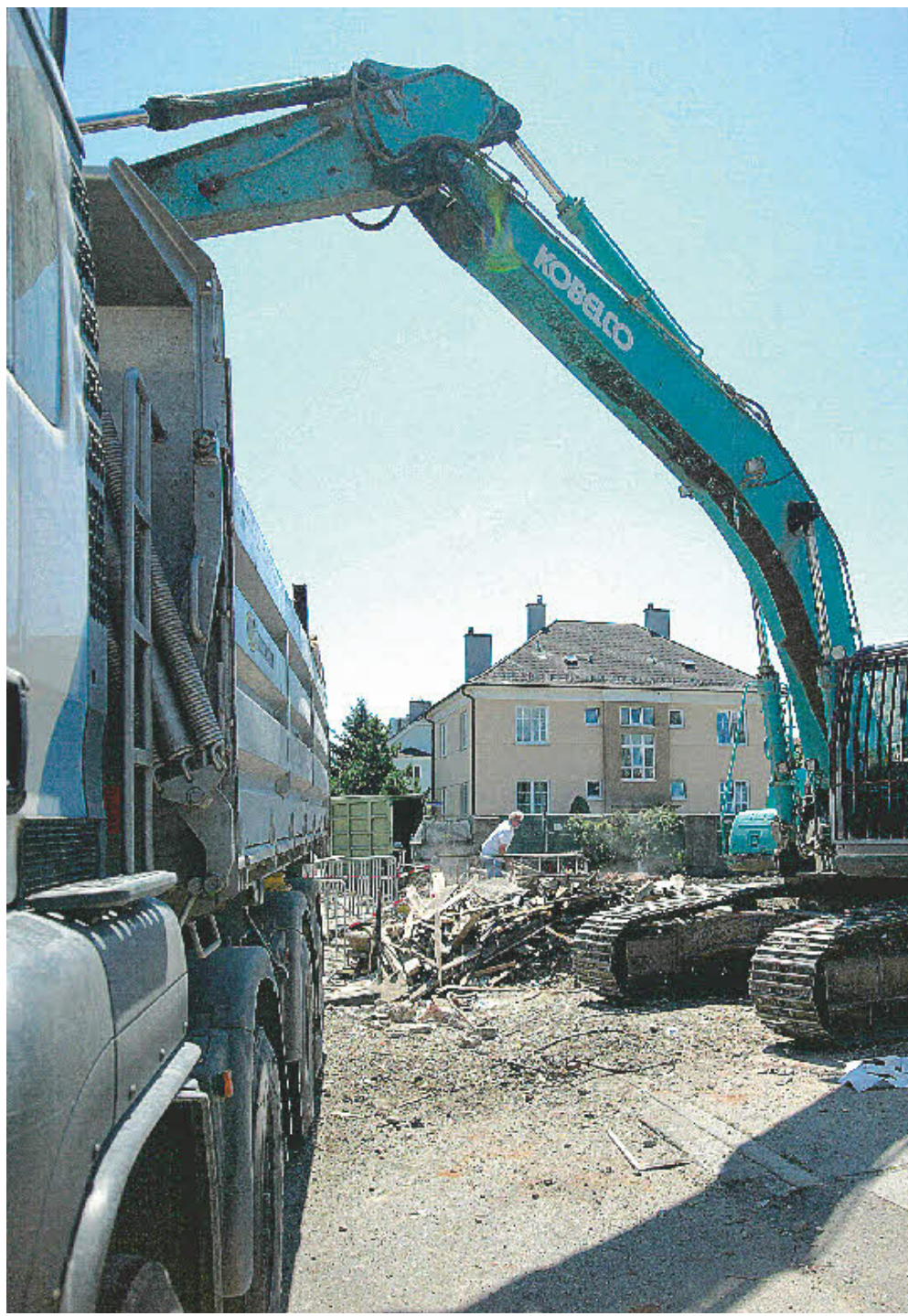
„Ganz neuer Anfang“: Stadtrat organisierte Voith-Wohnung für die Harzhausers (re.). Die Unglücksstelle ist von 40 Tonnen Schutt freigebagert. Wunsch der überlebenden 21-Jährigen: Eine Wiese statt Bebauung

Top-Sicherheit Auch in der Nachbarschaft ist noch nicht Normalität eingekehrt. Drei Familien sind weiter ohne Gasanschluss, sie bekamen Elektro-Ersatzgeräte von den EVN. Einige im Grätzl fühlen sich unsicher und wenig informiert. Auf ihr Betreiben fand Donnerstagabend eine Versammlung mit EVN und Stadtvertretern statt. Forderung: Bei der bevorstehenden Erneuerung der Leitungen Einbau modernster Sicherheitstechnik. „Selbstverständlich höchste Standards“, garantiert EVN-Sprecher Stefan Zach.